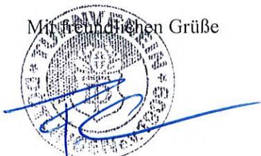
Fabian Grashorn (2. Vorsitzender TV Dötlingen)

Anlage 1. Luftbild Maulwurfschäden Anlage 2. Angebot Gärtner - Maulwurfssperre